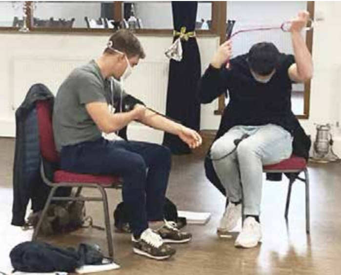
Ausbildung unter Pandemiebedingungen in der ZAS des DRK Frankfurt.